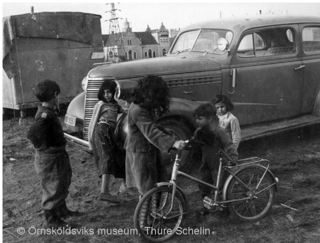
Romska barn vid en lägerplats i Lungviksparken, Örnköldsvik, 1951. Foto: Thure Schelin, Örnköldsviks museum, OVM TS1034 och OVM TS1035.